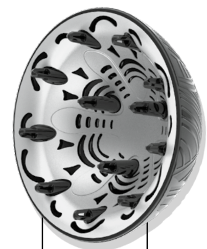
Profundidad y sistema de circulación del aire diseñados a medida. Interior térmico de aluminio

Trabaja exclusivamente con el secador iónico/cerámico de 1875 vatios The Curl Collective™